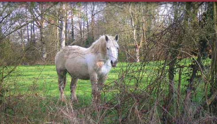
Το κορίτσι και τα άλογα που χορεύουν του Δημήτρη Σπύρου Ελλάδα, 2002, έγχρωμο, 15', ντοκιμαντέρ

Στην ετήσια γιορτή του νησιού τους, οι ξενιτεμένοι άντρες, ναυτικοί οι περισσότεροι, επιστρέφουν για να γιορτάσουν με τους δικούς τους. Κάποιοι όμως δεν γυρίζουν κι ένα κορίτσι βιώνει διαφορετικά τη γιορτή.