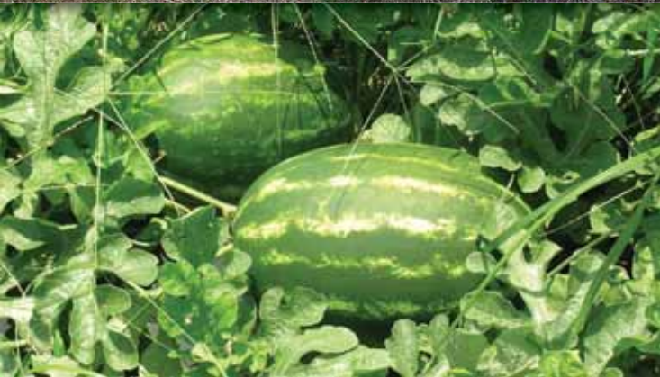
Αθέμιτος συναγωνισμός του Δήμου Αβδελιώδη Ελλάδα, 1983, έγχρωμο, 22

Στην ετήσια γιορτή του νησιού τους, οι ξενιτεμένοι άντρες, ναυτικοί οι περισσότεροι, επιστρέφουν για να γιορτάσουν με τους δικούς τους. Κάποιοι όμως δεν γυρίζουν κι ένα κορίτσι βιώνει διαφορετικά τη γιορτή.