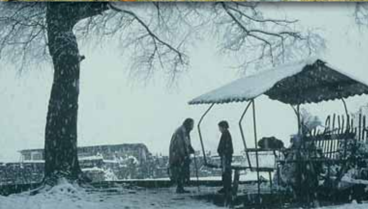
Η άλλη Τράπεζα του George Ovashvili Γεωργία-Καζακστάν, 2009, Έγχρωμο, 90΄

Ένα αγόρι βάζει σκοπό της ζωής του να φέρει πίσω τον αγαπημένο του γάιδαρο, που του άρπαξε ένας τοκογλύφος. Οι δυσκολίες είναι πολλές και γίνονται σχεδόν αξεπέραστες εξ αιτίας του σκηνικού μιας εμφύλιας πολεμικής διαμάχης, που εκτυλίσσεται παράλληλα.