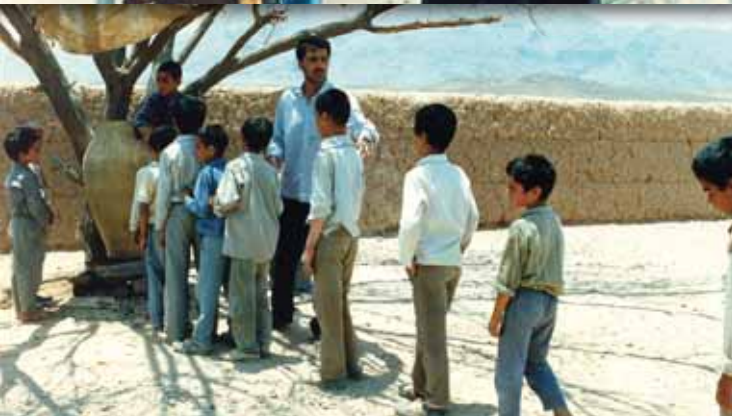
Το πιθάρι του Εμπραχίμ Φορουζές Ιράν, 1992, έγχρωμο, 86΄

Ένα αγόρι που ζει σε αναμορφωτήριο, δεν πιστεύει ότι η μητέρα του έχει πεθάνει. Όταν στο αναμορφωτήριο έρχεται μια καινούρια κοινωνική λειτουργός, το αγόρι πιστεύει ότι είναι η μητέρα του και κάνει τα πάντα για να ζήσει μαζί της.