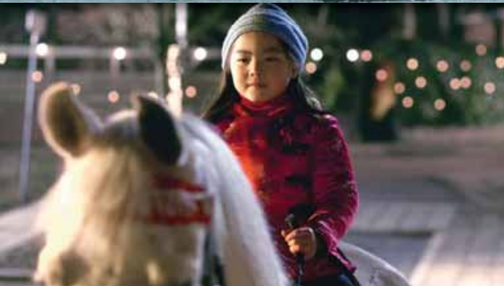
Το άλογο της Γουίνκι της Mischa Kamp Ολλανδία, 2005, έγχρωμο, 96΄

Με πρωταγωνιστή έναν νεαρό πρόσφυγα που αναζητά τον πατέρα του, η ταινία δείχνει τις διαλυμένες σχέσεις μεταξύ κρατών και ανθρώπων. Επίσης εξηγεί ότι η συμφιλίωση είναι εφικτή, αλλά πάντα υπάρχουν τραύματα, λύπες, θύματα όταν τα σύνορα καθορίζονται με τη βία.