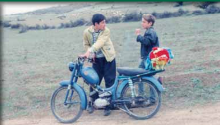
Ο άνεμος στις ιτιές του Μοχαμάντ Αλί Ταλεμπί Ιράν, 1999, έγχρωμο 80΄

Ένας μαθητής πρέπει να αντικαταστήσει το τζάμι που έσπασε στην τάξη του. Χιτσκοκικό μάθημα σκηνοθεσίας σε σενάριο του Αμπάς Κιαροστάμι, που επινόησε ακόμα έναν μύθο αισώπειας λιτότητας και λαϊκής σοφίας.