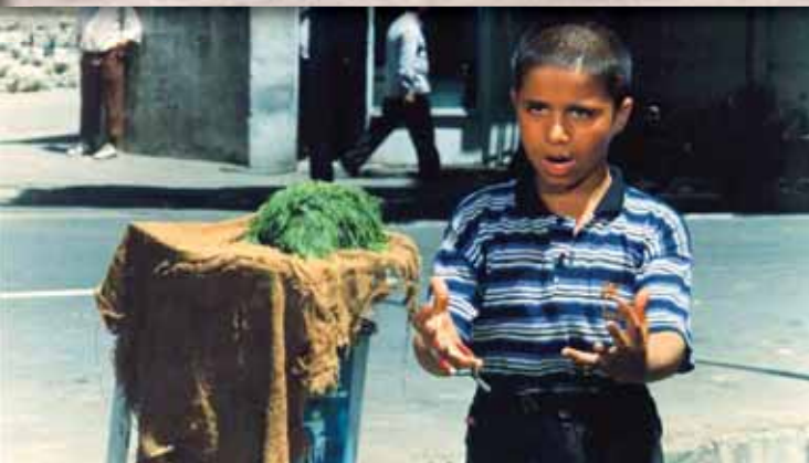
Μητρική αγάπη του Καμάλ Ταμπρίζι Ιράν, 1998, έγχρωμο, 90΄

Ένας μαθητής πρέπει να αντικαταστήσει το τζάμι που έσπασε στην τάξη του. Χιτσκοκικό μάθημα σκηνοθεσίας σε σενάριο του Αμπάς Κιαροστάμι, που επινόησε ακόμα έναν μύθο αισώπειας λιτότητας και λαϊκής σοφίας.